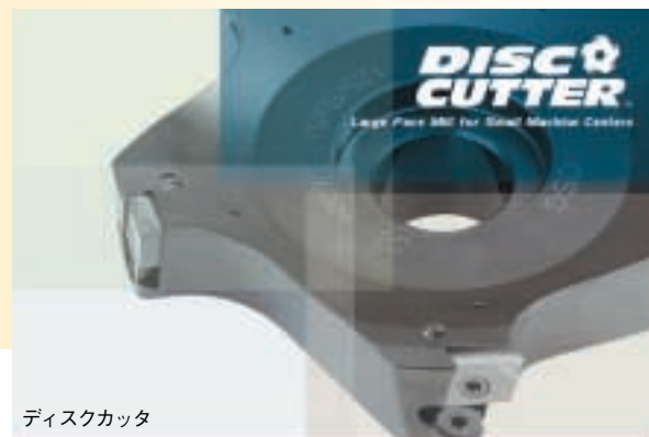
ディスクカッター