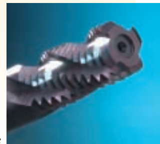
NCプラネットカッタ