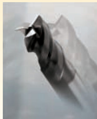
3刃スロッシング用 スタブ形超硬エンドミル